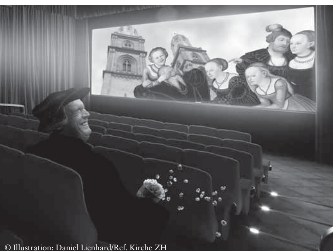
© Illustration: Daniel Lienhard/Ref. Kirche ZH

Ich lade Sie also herzlich ein und freue mich, wenn viele von Ihnen – der Predigtgemeinde Fraumünster – dabei sind im Oktober und November. Niklaus Peter